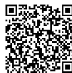
お申込みフォーム 2次元コード